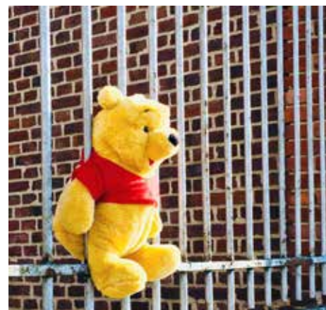
▲ Vele Alkenaren deden mee aan de berenzoektocht, tot plezier van kinderen en ouders.