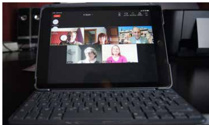
▲ Ook de N-VA-schepenen vergaderen digitaal.